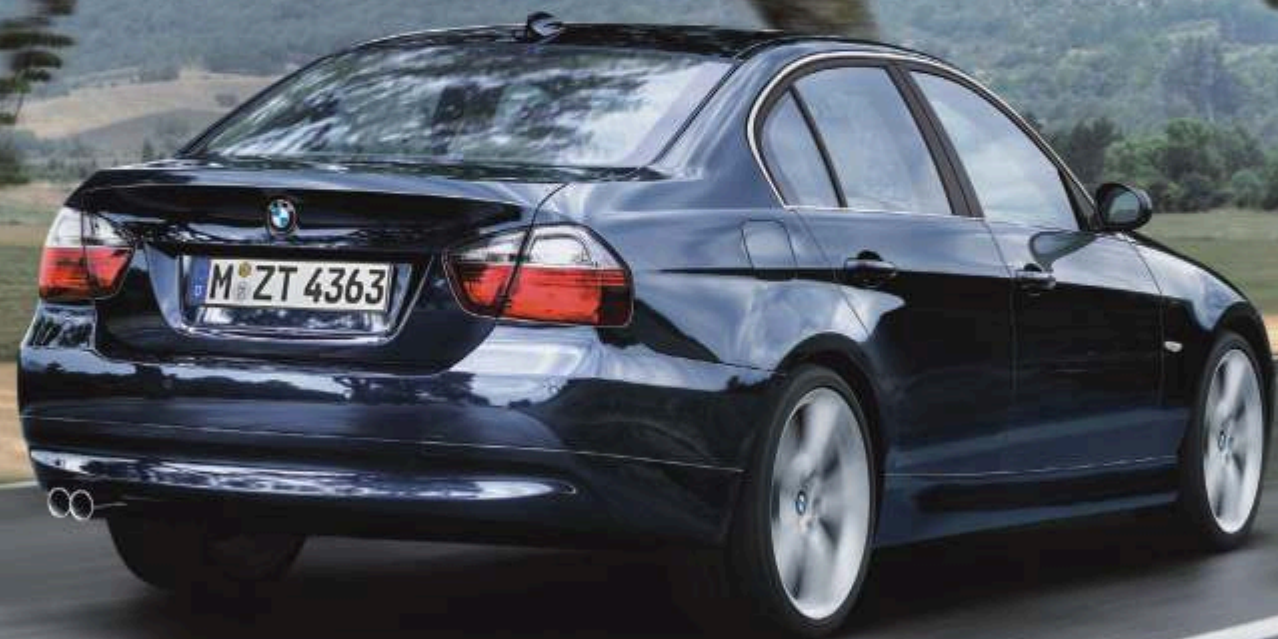
Foto mostrada al mòdul de portada amb equipament opcional. Emissió de CO 2 : 128 g/km. Consum mitjà: 4,8 l/100 km.

Els grans èxits són fruit del treball i de la innovació. Per això, no és casualitat que el BMW 320d incorpori la innovadora tecnologia BMW EfficientDynamics, ni que el resultat d'això siguin 177 CV i un consum de només 4,8 litres per 100 quilòmetres. I tampoc no és casualitat que ara puguis escollir entre quatre configuracions Top Line Edition disponibles per a Berlina i Touring. No, no ho és. Perquè els nostres èxits no s'han aconseguit mai per casualitat.