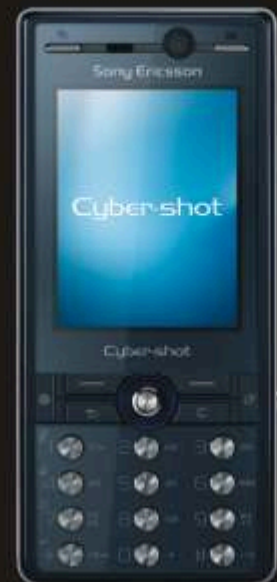
Sony Ericsson k810i

i a més emporta't aquest Sony Ericsson Cyber-shot per 0€*